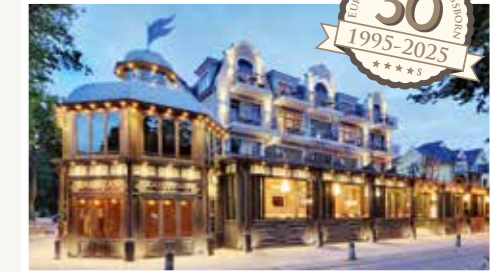
Der große Bruder, das 4 Sterne Superior Belle Epoque Strandhotel direkt an der Ostseeallee.