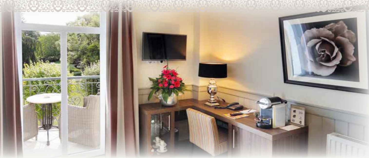
Deluxe Park View Doppelzimmer mit Balkon & Deluxe Boutique Doppelzimmer