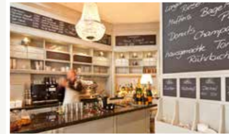
Kaffee und Kuchen mit Meerblick im Jugendstil Turm.

BRASSERIE BELON'S SEAFOOD · SUSHI · OYSTER BAR