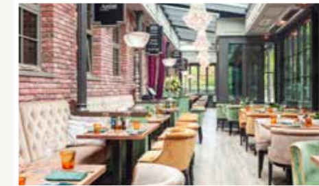
Französische Klassiker und Seafood, Sushi & Oyster Bar.

BRASSERIE BELON'S SEAFOOD · SUSHI · OYSTER BAR