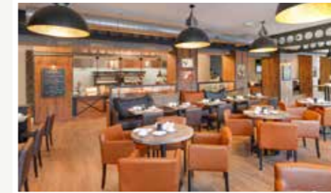
Unsere Rotisserie mit Geflügel Spezialitäten, BBQ Spießen, Burgern, Steaks & Turkey Legs, mit Showküche, Lavastein Grill & großer Terrasse.