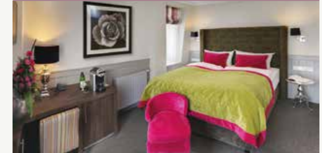
Park View Doppelzimmer mit Balkon

Unsere Premium Kategorie. Zur Südseite gelegen, mit Blick auf den Lindenpark. Ca. 21 m 2 . Belegung max. 2 Personen.